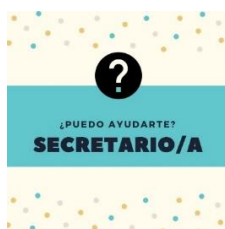
Ilustración 1: Distintivo que utiliza en alumno o alumna secretaria en su día de trabajo.