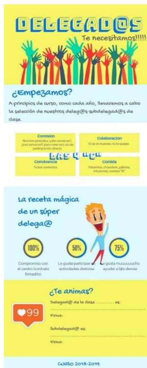
Ilustración 2: Cartel de selección de los delegados y delegadas del presente curso escolar.

En la Junta de Delegados se toman decisiones que afectan al conjunto del alumnado, principalmente la referida a la celebración de días clave (Día de la Alimentación Saludable, Día en Contra de la Violencia a la Mujer...)