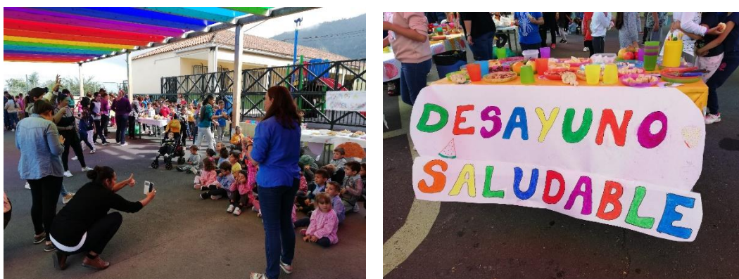
Ilustración 6: Celebración del Día de la Alimentación Saludable con concurso de mesas saludables por tutorías.