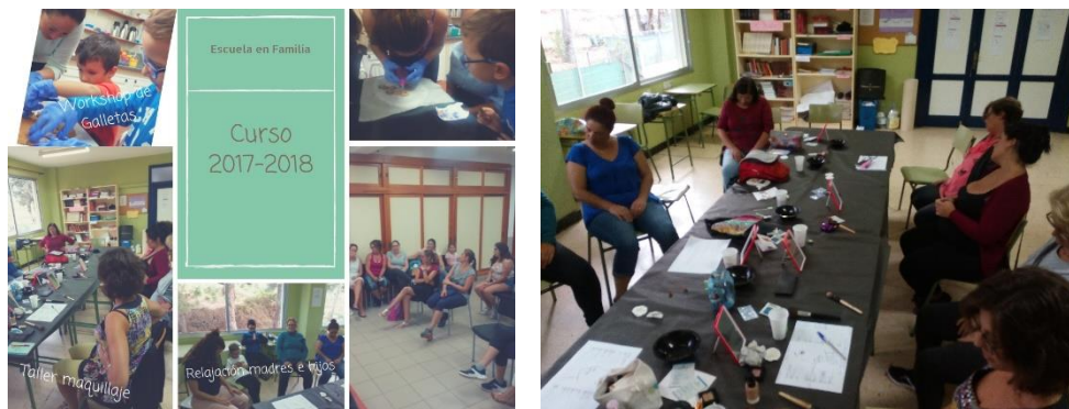
Ilustración 5: Taller de maquillaje y yoga para familias en el curso 2017-2018 impartido por la coordinadora de la Red de Participación (quien suscribe este proyecto)