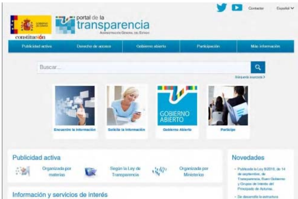
Imagen del Portal de Transparencia del Gobierno de España