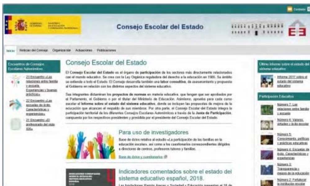
Imagen sacada de la web sobre Consejo Escolar del Estado

El Consejo participa en estas propuestas e informa sobre las necesidades de estudiantes y profesores y profesoras.