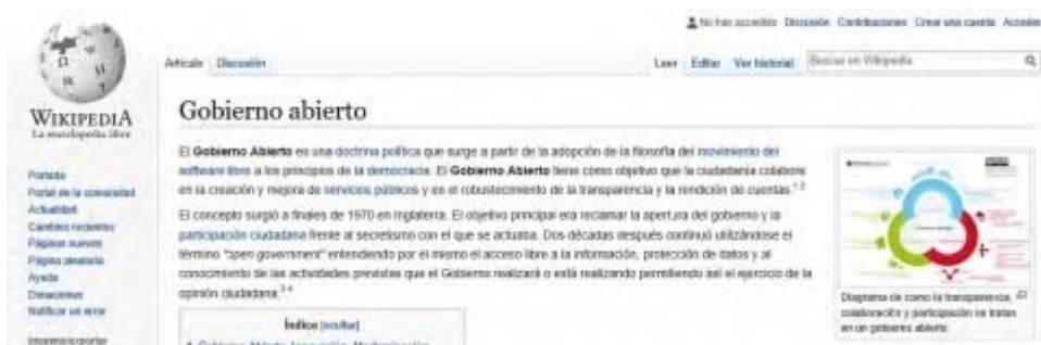
Imagen de la web de Wikipedia: Gobierno Abierto: https://es.wikipedia.org/wiki/Gobierno_abierto

Así se hace Wikipedia, con la participación y colaboración de todos