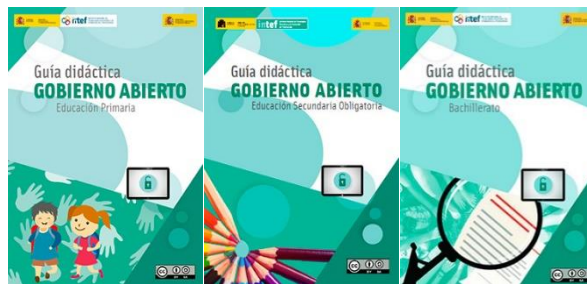
Imagen de las portadas de las Guías de Educación en Gobierno Abierto.

Como parte de esta iniciativa, cabe destacar también la elaboración, debate y edición de las Guías de Educación en Gobierno Abierto para Primaria, Secundaria y Bachillerato, que han sido traducidas a las lenguas españolas cooficiales, así como al inglés y al francés.